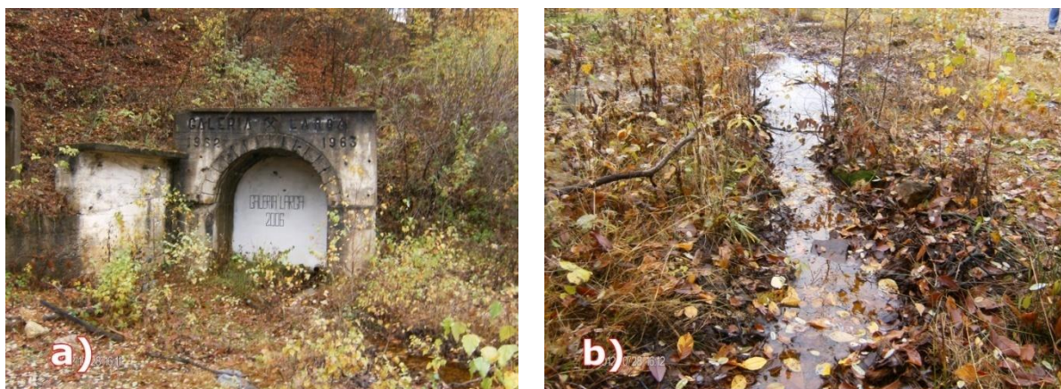
Figura 1.1. a) Galeria “Larga de Sus” (a); Canalul de scurgere al apei acide de mină (b) (noiembrie 2012)

Exemplu privind includerea figurilor în lucrarea de disertație: